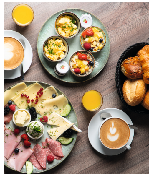
Planker Genuss für Zwei