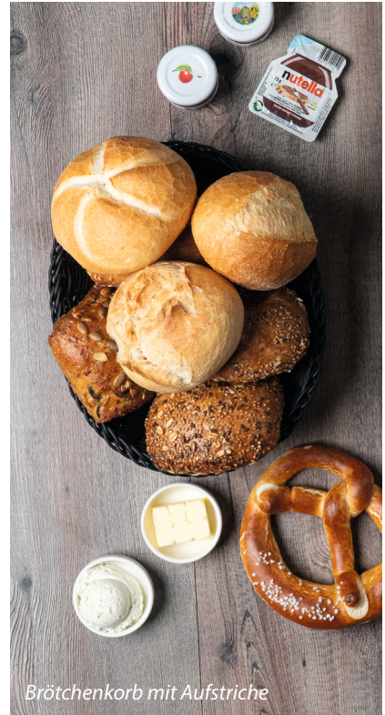
Brötchenkorb mit Aufstriche

2 Rühreier | Tomaten | Schrippe | Butter