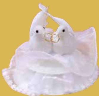
Taubenpaar mit Ringen 20,00 €