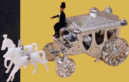
Kutsche mit Pferden 13,50 €