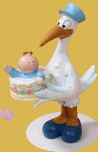
Storch mit Baby rosa/blau 13,75 €