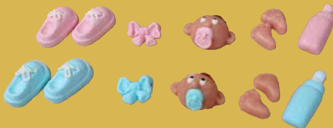
Dekorset „Baby“ rosa/blau 10,50 €