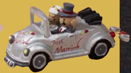
Brautauto 20,00 €