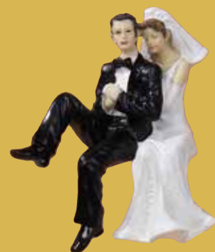
Brautpaar „Kantenhocker“ 24,50 €