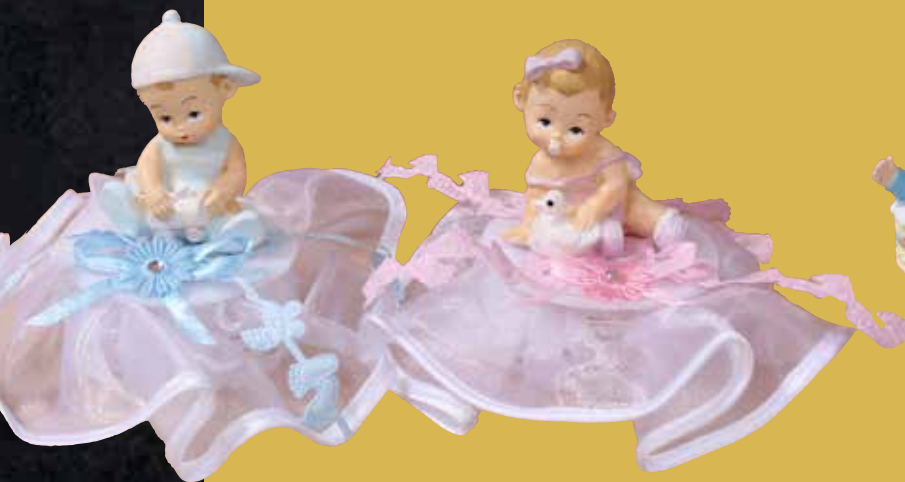
Baby-Figur rosa/blau 13,75 €