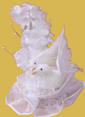
Taubenpaar mit Blütenbukett 31,50 €