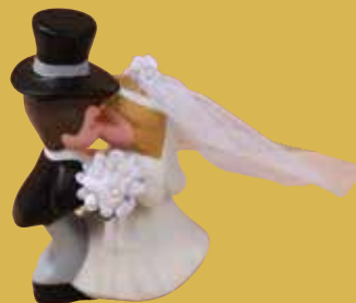
Küssendes Brautpaar 17,50 €