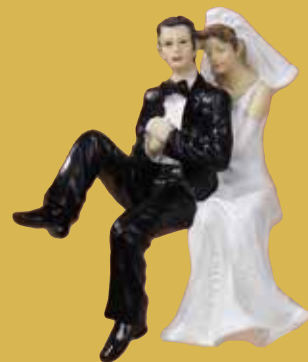
Brautpaar „Kantenhocker“ 24,50 €