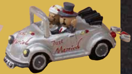
Brautauto 20,00 €