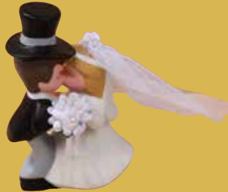
Küssendes Brautpaar 17,50 €