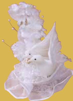
Taubenpaar mit Blütenbukett 31,50 €