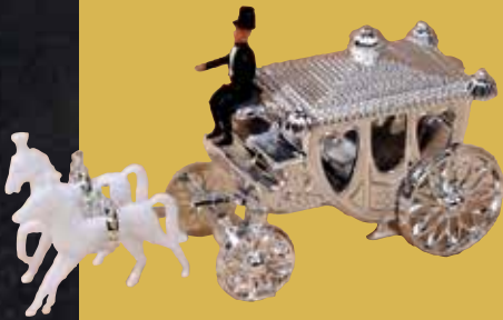
Kutsche mit Pferden 13,50 €